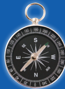
Etyka w biznesie