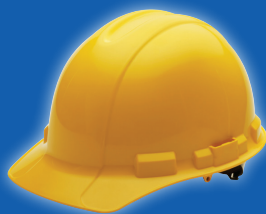
техника безопасности и охрана труда, здравоохранение и охрана окружающей среды