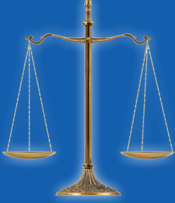
İnsan Hakları ve İşgücü

SC Johnson Tedarikçi Davranış Kuralları, şirketin dört temel alandaki tedarikçilere yönelik beklentilerini belirler.