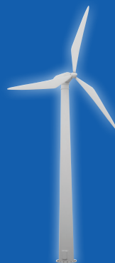
Phát triển bền vững